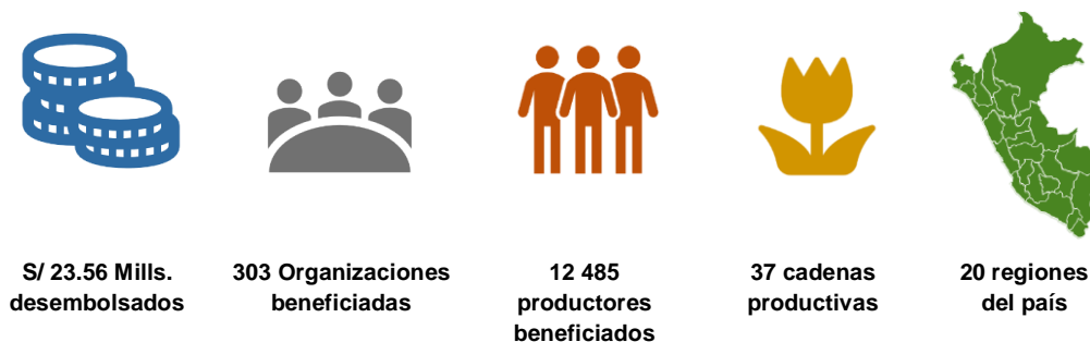
Figura N° 01 Intervención del Programa de Compensaciones para la Competitividad A Setiembre 2019